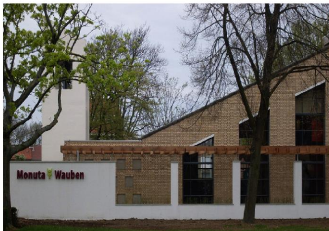
De Baandert - Sittard

Elke woensdag wordt in de Maria- & Bernadettekapel om 16 uur het Rozenhoedje gebeden.