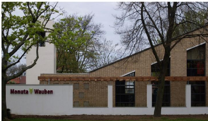
De Baandert - Sittard