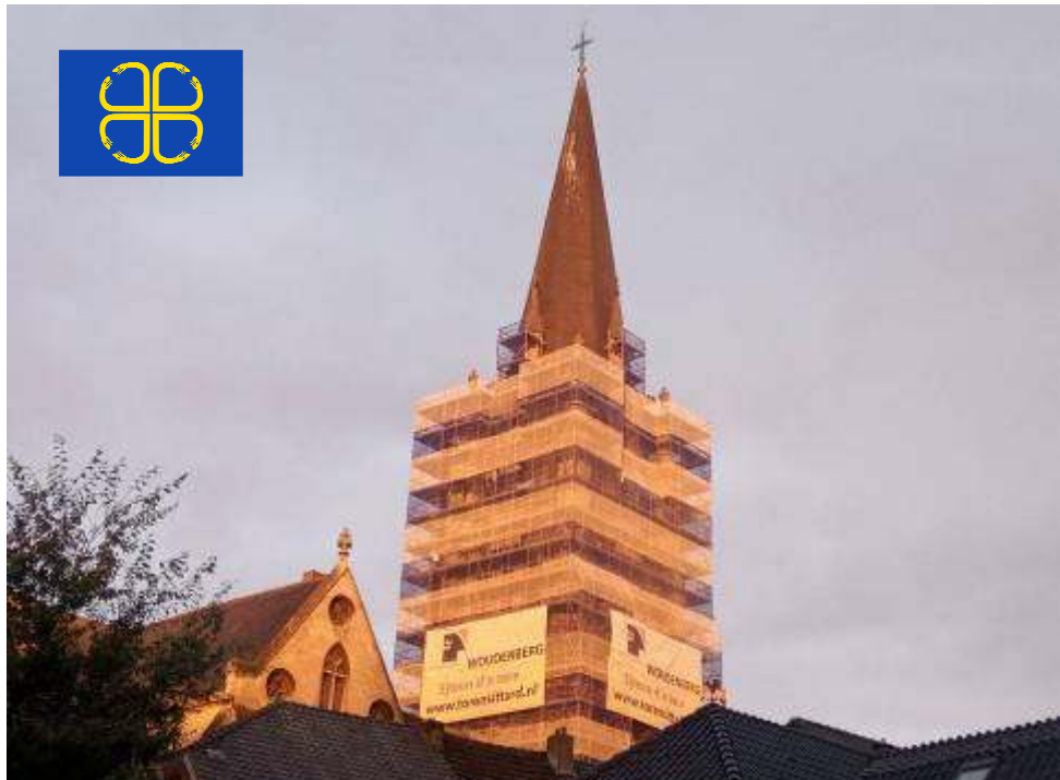
De Petrustoren bij het ochtendgloren