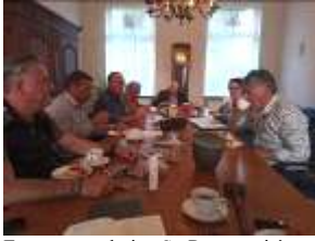
Eerste vergadering St. Rosacomité