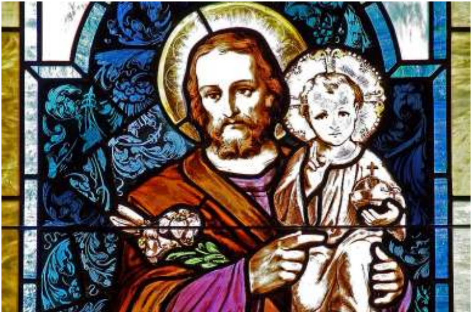
Een glas-in-loodraam met een afbeelding van St.-Jozef en het Kindje Jezus in de kerk van Maria Onbevlekt Ontvangen in Wilmington in de Amerikaanse staat New York.

Als een timmerman die “eerlijk zijn brood verdiende om voor zijn gezin te zorgen” is de aardse beschermer van Christus ook een voorbeeld voor arbeiders en degenen die zoeken naar werk en het recht op een waardig leven voor zichzelf en hun gezin.