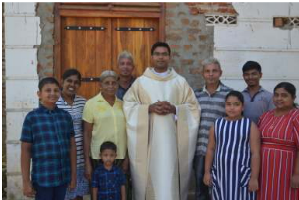
Kapelaan Weerawarna met zijn moeder en twee broers en hun gezinnen