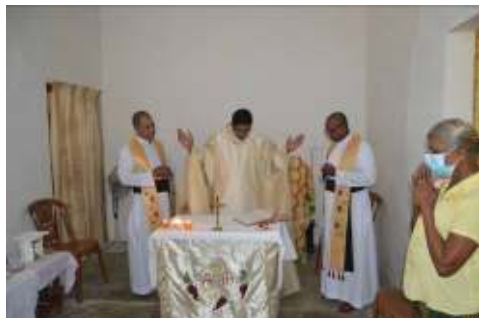
Eerste Mis bij moeder thuis

Ik ben ook naar Sri Lanka gegaan omwille van mijn moeder zodat zij kon meeleven met mij bij mijn priesterwijding. Wat ook mooi was dat mijn 'vocation director' (de pastoor die mij heeft begeleid naar klein-seminarie en die heeft ontdekt dat ik roeping had), ook vicaris voor de liturgie is in ons bisdom. Hij heeft dus alles gedaan bij de voorbereiding van mijn priesterwijding. Dan nog iets bijzonders over mijn eerste heilige mis. Die was de dag na de wijding,