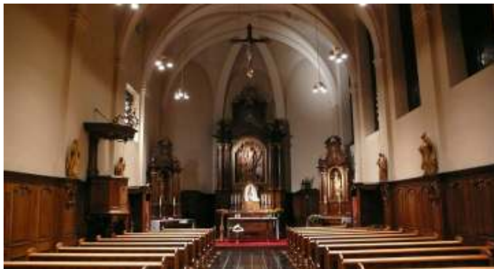
Kapel Agnetenberg in de Plakstraat

Er verdwijnt een stuk onvervangbaar religieus erfgoed uit Sittard: het interieur van de kapel van de Agnetenberg in de Plakstraat, zeg maar de Michiel 'in het klein'. Natuurlijk heb ik begrip voor de vele moeilijkheden die het openhouden of herbestemmen van religieus erfgoed met zich meebrengt. Fijn dat er een herbestemming wordt gevonden voor het interieur dat blijkens de mededelingen in de pers verhuist naar Noorbeek. Dat is nog altijd beter dan opstoken... Ik ga geen commentaar geven op de politieke besluitvorming: de tijd is voorbij dat de deken politieke invloed uitoefent. Maar mensen, wat gaat het mij als grasgroene Sittardenaar aan het hart dat de kapel wordt ontmanteld. Wat intens triest dat we er als Sittardese gemeenschap niet in zijn geslaagd dit monument