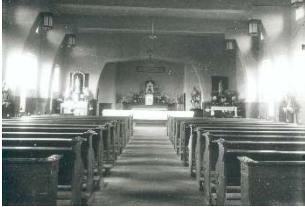
Noodkerk Overhoven vierving van onze communicanten. Zij zullen zich voorstellen. Zij doen op 18 mei hun eerste H. Communie.

weer vastenzakjes achter in de kerk liggen. U kunt deze meenemen. T/m Pasen kunnen deze zakjes, hopelijk goed gevuld, weer teruggebracht worden. U kunt ze deponeren in het