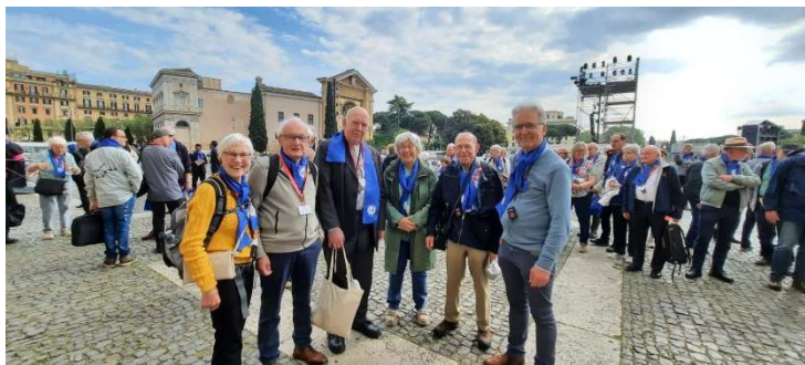
Pelgrimsreis Rome Bisdom Roermond 27 april – 3 mei